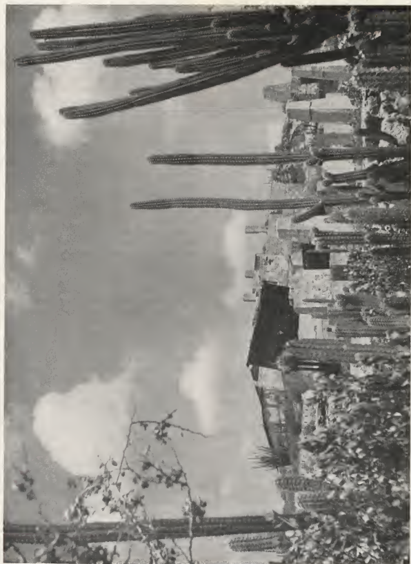
The Aruba Goldmines, one of Aruba's economic pillars in the past century (viz. page 10).